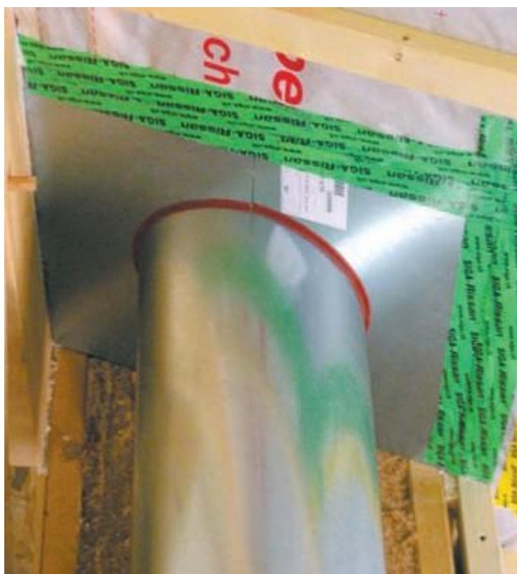
Mise en place d'une plaque d'étanchéité à l'air sur un conduit de fumée

En cas de travaux ultérieurs, il est bon de faire appel à des professionnels formés et sensibilisés à l'étanchéité. Vérifiez que l'artisan ait la mention RGE et demandez-lui clairement ses compétences en la matière.